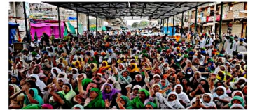
ਗਿਣਤੀ ਵਿਚ ਸ਼ਾਮਲ ਹੋਏ। ਜਿਨ੍ਹਾਂ ਕਿਸਾਨਾਂ ਨੇ ਫਸਲ ਦੀ ਵਾਢੀ ਕਰ ਲਈ ਹੈ ਅਤੇ ਵੇਚ ਚੁੱਕੇ ਹਨ, ਉਹ ਸਿੰਘ ਮੋਰਚੇ 'ਤੇ ਵੀ ਪਹੁੰਚਣੇ ਸ਼ੁਰੂ ਹੋ ਗਏ ਹਨ।

ਜਦੋਂ ਤੋਂ ਕਣਕ ਦੀ ਖਰੀਦ ਸ਼ੁਰੂ ਹੋਈ ਹੈ, ਕੇਂਦਰ ਸਰਕਾਰ ਨਵ-ਉਦਾਰਵਾਦੀ ਨੀਤੀਆਂ ਲਾਗੂ ਕਰਨ ਲਈ ਨਿਰੰਤਰ ਕੋਸ਼ਿਸ਼ ਕਰ ਰਹੀ ਹੈ। ਪੰਜਾਬ, ਹਰਿਆਣਾ ਅਤੇ ਰਾਜਸਥਾਨ ਦੇ ਬਹੁਤ ਸਾਰੇ ਹਿੱਸਿਆਂ ਵਿੱਚ ਬਾਰਦਾਨੇ ਦੀ (ਵੱਡੇ ਬੈਗ) ਦੀ ਮਾਰਕੀਟ ਵਿੱਚ ਸਮੇਂ ਸਿਰ ਪਹੁੰਚ ਨਹੀਂ ਹੋ ਰਹੀ, ਜਿਸ ਕਾਰਨ ਕਿਸਾਨ ਨੂੰ ਕਈ ਦਿਨਾਂ ਤੱਕ ਮੰਗੀ ਵਿੱਚ ਬਹਿਣਾ ਪੈ ਰਿਹਾ ਹੈ ਅਤੇ ਪਰਾਈਵੇਟ ਵਪਾਰੀਆਂ ਨੂੰ ਫਸਲ ਵੇਚਣ ਲਈ ਮਜ਼ਬੂਰ ਹੋਣਾ ਪੈ ਰਿਹਾ ਹੈ। ਸਰਕਾਰ ਖੁਦ ਮੰਗੀ ਪ੍ਰਣਾਲੀ ਨੂੰ ਕਮਜ਼ੋਰ ਕਰ ਰਹੀ ਹੈ ਅਤੇ ਵਿੱਚ ਮੰਗੀਕਰਨ ਵਿਗੜਨ ਦਾ ਹਵਾਲਾ ਦੇ ਕੇ ਉਨ੍ਹਾਂ ਨੂੰ ਖਤਮ ਕਰਨ ਦੇ ਦਾਅਵੇ ਕਰਦੀ ਹੈ। ਜ਼ਰਦਸਤੀ ਸਿੱਖੀ ਆਦਾਇਗੀ ਕਰਨਾ ਅਤੇ ਜ਼ਮੀਨੀ ਰਿਕਾਰਡਾਂ ਦੀ ਮੰਗ ਕਰਨਾ ਵੀ ਇਸ ਦਿਸ਼ਾ ਵਿਚ ਇਕ ਕਦਮ ਹੈ, ਜਿਸ ਦਾ ਕਿਸਾਨ ਸਮਝ ਵਿਚੋਂ ਕਰਨਗੇ। ਸੰਯੁਕਤ ਕਿਸਾਨ ਮੋਰਚੇ ਦੇ ਸਮੇਂ 'ਤੇ ਕਿਸਾਨਾਂ ਮਜ਼ਦੂਰਾਂ ਨੇ ਵਾਪਸ ਦਿੱਲੀ ਆਉਣਾ ਸ਼ੁਰੂ ਕਰ ਦਿੱਤਾ ਹੈ। ਅੱਜ ਕਿਸਾਨ ਟਿਕਰੀ ਬਾਰਡਰ 'ਤੇ ਵੱਡੀ