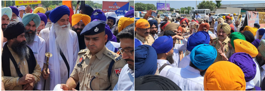
ਧਨੌਲਾ (ਬਰਨਾਲਾ) / ਮਵਦੀਲਾ ਬਿਓਰੋ

ਸ੍ਰੀ ਗੁਰੂ ਗ੍ਰੰਥ ਸਾਹਿਬ ਜੀ ਦੇ ਬੇਅਦਬੀ ਦੇ ਦੋਸ਼ੀਆਂ ਨੂੰ ਸਜ਼ਾਵਾਂ ਦਿੱਤੀਆਂ ਜਾਣ ਤੇ ਬੰਦੀ ਸਿੰਘਾਂ ਨੂੰ ਰਿਹਾਅ ਕੀਤਾ ਜਾਵੇ -ਅਜਨਾਲਾ, ਖੁਖਰਾਣਾ, ਜੋਗੇਵਾਲਾ