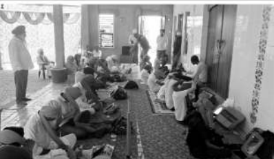
ਮੋਗਾ / ਮਵਦੀਲਾ ਬਿਓਰੇ