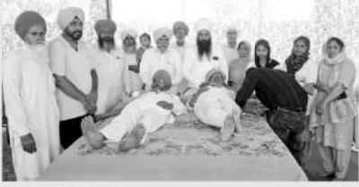
ਮੋਗਾ / ਮਵਦੀਲਾ ਬਿਓਰੇ