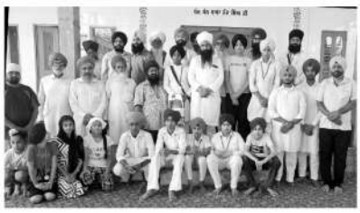
ਸਰਟੀਫਿਕੇਟ ਅਤੇ ਨਗਦ ਰਾਸ਼ੀ ਦੇ ਕੇ ਸਨਮਾਨਿਤ ਕੀਤਾ।